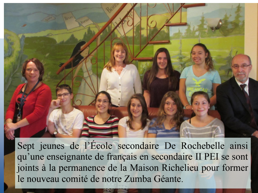
Sept jeunes de l'École secondaire De Rochebelle ainsi qu'une enseignante de français en secondaire II PEI se sont joints à la permanence de la Maison Richelieu pour former le nouveau comité de notre Zumba Géante.