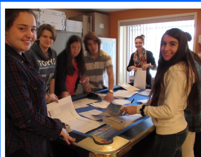
Les membres du comité préparent les enveloppes contenant les formulaires de participation qu'ils remettront par la suite aux étudiants de Rochebelle.

De son côté, la permanence de la Maison Richelieu enchaîne les demandes d'appui auprès des entreprises, des fondations et des élus. Les employés et bénévoles sollicitent leurs parents et amis.