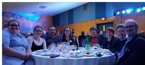
Soirée Vins et Fromages du Club et de la Fondation Richelieu Québec-Ancienne-Lorette